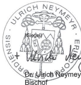
Dr. Ulrich Neymeyr Bischof