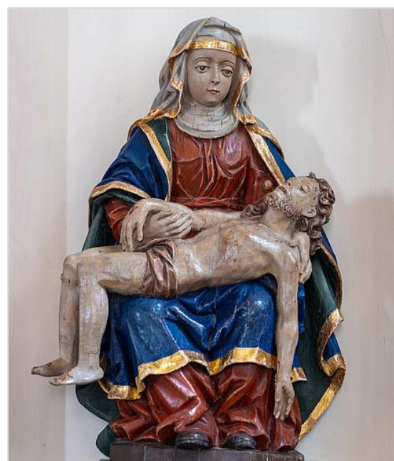
Gnadenbild im rechten Seitenschiff der Kapelle