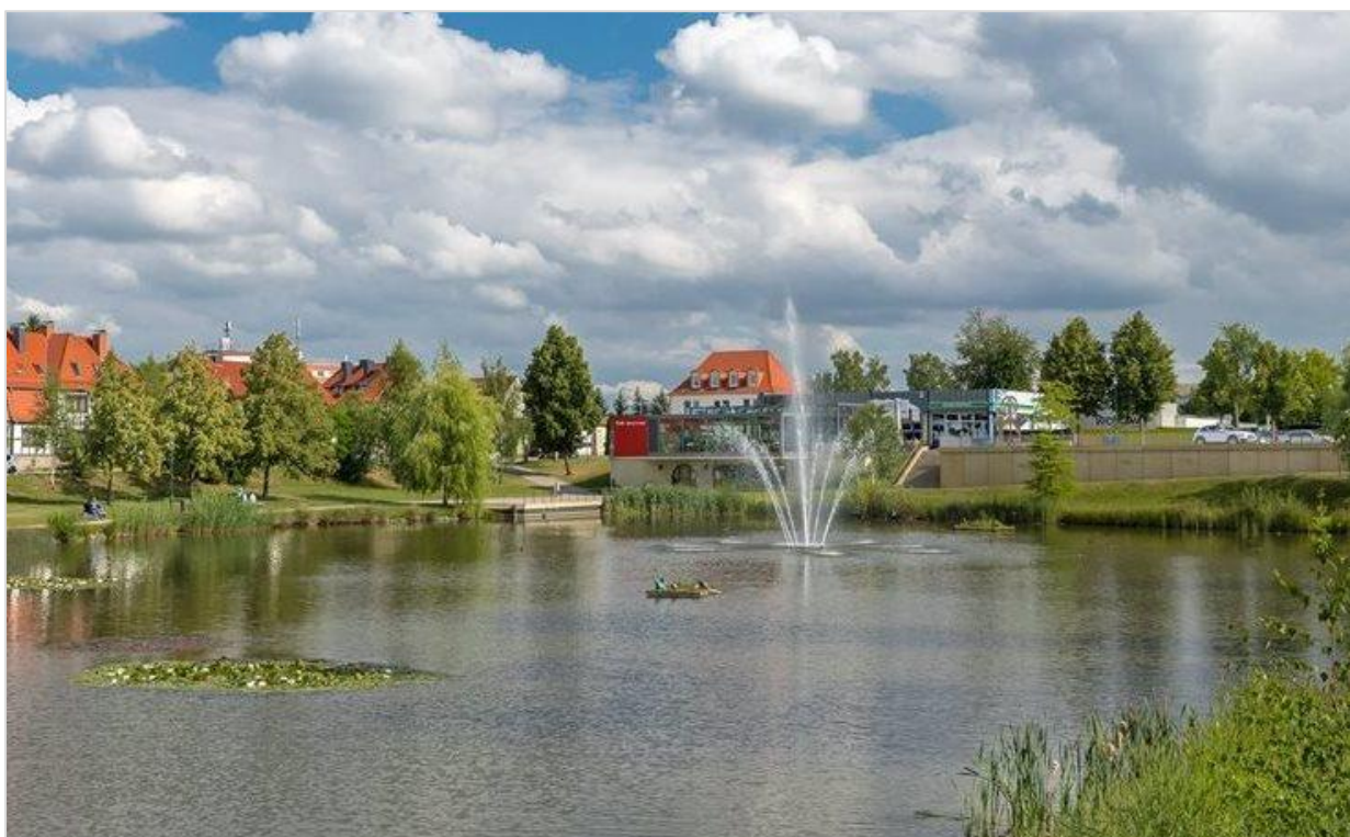
Märtens Teich in Leinefelde