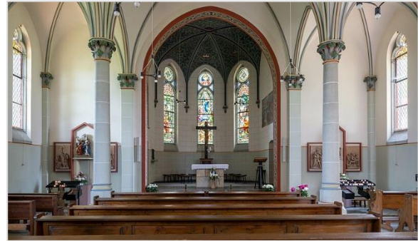
Innenansicht mit Altarraum

Da sich Wallfahrten immer größerer Beliebtheit erfreuten und die Kapelle die Pilgerströme nicht mehr fassen konnte, wurde 1898 der heute bestehende Bau errichtet.